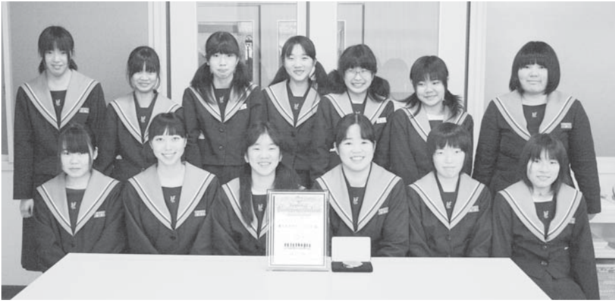
▶関西ブロック賞を受賞したボランティア部の生徒たち（11月25日、養父中学校）

ボランティア活動に取り組む青少年をたたえる第16回ボランティアスピリット賞（ブルデンシヤル生命、シブラルタ生命など主催）の関西ブロックの表彰式が12月9日、神戸市中央区の神戸朝日ホールで開かれ、養父中学校ボランティア部がブロック賞を受賞しました。