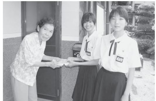
▶夏休みには、高齢者などのお宅にお弁当を届ける給食サービスを体験（11平成24年7月25日）

また、がん治療で頭髪が抜けた患者のために手作りの「タオル帽子」を贈るほか、近くの高齢者施設を定期的に訪問して