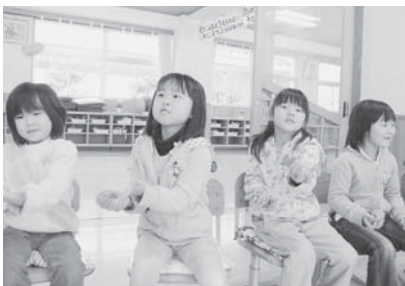
▲お手玉うまくできるかな?(=1月29日、関宮小学校)

養父市関宮193 関宮ふれあいの郷内 TEL: 667-3248 FAX: 667-3351