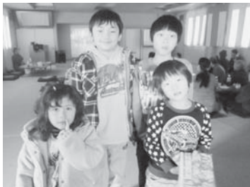
▲子どもたちも大勢参加。映画よりも(?)お菓子やゲームで大満足(=1月20日、下網場コミュニティセンター)

「懐かしいなあ。こりゃ、何回見てもええわ」新年の余韻が残る1月20日、下網場コミュニティセンターが、昭和の香り漂う映画館に变身しました。 下網場区歳末たすけあい地域ふれあい事業でのひとコマです。福祉連絡会で「ひとり暮らしのお年寄りに喜んでもらうには、どうしたらいいだろう」「区民に気軽に参加してもらうには」など話し合った結果、懐かしい時代劇を見ながら食事を