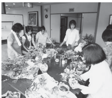
▶各自で持ち寄った色鮮やかな花を飾りつける女性民生委員ボランティアのみなさん

この日は、女性民生委員ボランティアグループ17人がスタンプとして参加しました。昼食をとりながら交流したあと、介護予防サポーターようかによる「誤えん性