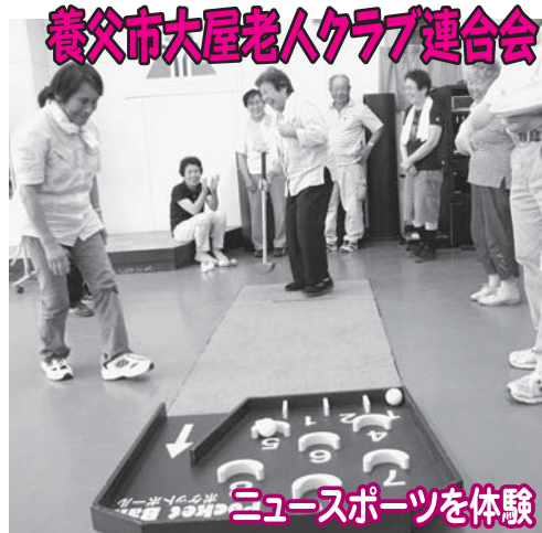
養父市大屋老人クラブ連合会

「こんなに楽しいゲームならみんなも喜ぶなあ」「さっそく今度やってみようか」と、笑顔で話す参加者。