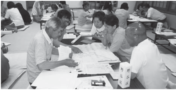
▲建屋小学校区地区福祉委員会（=7月2日、建屋教育集会所）

災害時に支援が必要な人を本人や家族の同意に基づき関係者が情報を共有する「ささえあい」