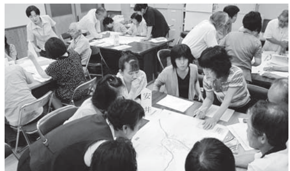
▶出合地区福祉委員会（=7月4日、であこの里）

今回の委員会では、大雨で区全域に洪水や土砂災害が発生する恐れがある区は、「災害時、区内でより安全な場所」について改めて話し合われ、避難場所や避難経路の再確認と、消火栓や防火水槽の位置を点検するなど、防災面についての検証に力をいれました。