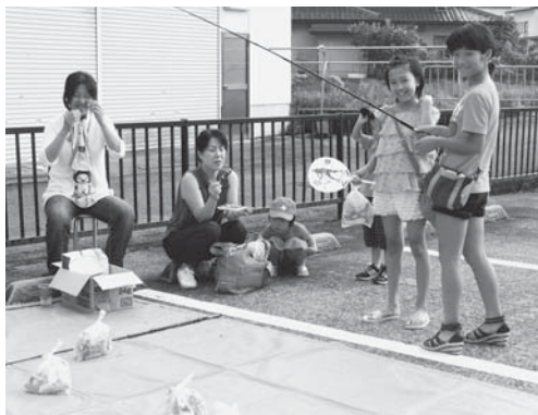
▲お手製の釣竿を使ったお菓子釣り。上手に釣れるかな（=7月27日、旭町区）

のかけ声で始まり、お目当ての景品を目指して会場は盛り上がりを見せました。 2人の子どもと参加したお母さんは「こ