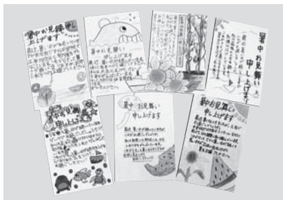
▲高齢者が読みやすいように濃く、はっきりした文字で書かれています(=7月23日、関宮ふれあいの郷)

養父市関宮193 関宮ふれあいの郷内 TEL: 667-3248 FAX: 667-3351