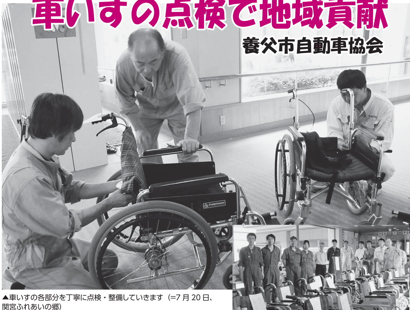
▲車いすの各部分を丁寧に点検・整備していきます (=7月20日、関宮ふれあいの郷)