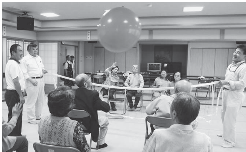
▲福祉連絡会が中心となり行った虹の街区ミニデイサービス(=平成24年5月30日、高柳ふれあい倶楽部)