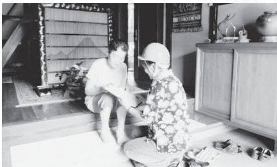
▶福祉委員の友愛訪問（=平成24年6月2日、高柳合区）