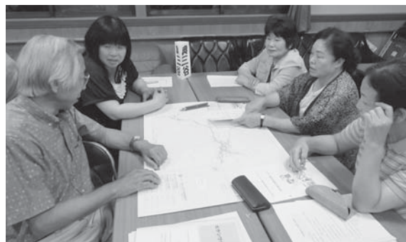
▲宿南地区福祉委員会(=6月12日、宿南ふれあい倶楽部)

長年の懸案であった、各行政区への福祉委員の設置がすすみ、9割を超える区で福祉委員が委嘱されるようになりました。これにともない、福祉連絡会で取り組む、見守り活動の一つである「福祉防災マップづくり」も60行政区で作成が終了。各地の福祉委員会では熱心にマップの見直しが行われ、会場は熱気にあふ