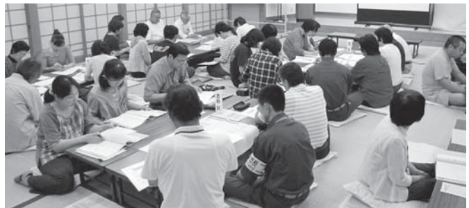
▲西谷地区福祉委員会（=6月24日、西谷公民館）

れ、今後、地区福祉委員会の招集、委員会の進行、意見のとりまとめなどが行われます。