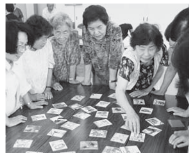
▲ニュースポーツのほかにも、歌を歌いながら札を取る唱歌カルタも行いました(=7月11日、大屋公民館)

7月11日、養父市大屋老人クラブ連合会の女性部と各地区役員を対象にした、ニュースポーツ講習会が大屋公民館で開催されました。これは、大屋地域の各老人クラブを今後ますます活性化していくと計画したもので、42人が参加しました。ニュースポーツは、レクリエーションの一端として誰でも気軽に楽しめることを主眼においたスポーツで