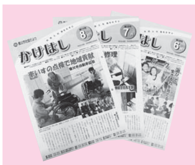
▲福祉や地域の情報を発信する広報紙「かけはし」は一般会費が使われています