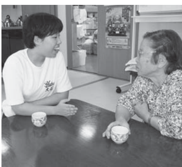
▶お年寄りと一緒に楽しく会話するボランティア部の生徒（＝8月29日、ふれあいいきいきサロンそよ風）

同部は、社協と連携しながら、ひとり暮らし高齢者に「ふれあい郵便」の手紙を書いたり、毎週第3土曜に近くの高齢者施設「喫茶コーナー」を設け利用者と交流したりするなど、幅広い活動を行っています。