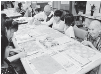
▲色や模様によって雰囲気も変わり、自分だけの宝物ができました(=8月7日、デイサービスセンター「ふれあい」)

この交流会には、大屋学童クラブの児童15人が参加し、デイサービス利用者と一緒に小物入れ作りに挑戦。開いた牛乳パックに切込みを入れ、カゴの型に整えていき、自分で好きな色に染めた和紙を貼りつけます。「おじいちゃん、僕が切つてあげる」「じゃあこっち手伝つとくれ」など児童と利用者は