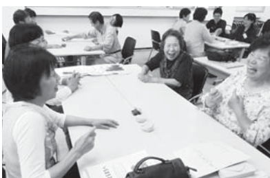
▲2回目の研修では、地域でできる頭を使ったゲーム「お手玉じゃんけん」を体験しました(=6月21日、福祉の杜)

介護予防サポーター研修(全6回)の受講生20人が、8月9日、八鹿公民館で最終回の講義のあと修了証を受けました。