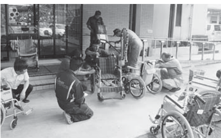
▲車いす1台1台を丁寧に点検・整備しました（=8月23日、デイサービスセンター「ふれあい」）

当日は、整備士10人がデイサービスセンター等で使用する車いす26台を点検。タイヤの空気圧やブレーキ、ネジの緩みがないかなど、安全に使