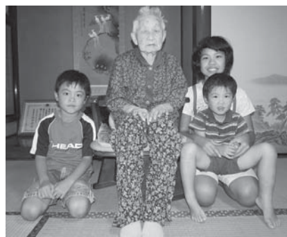
▶ひいばあちゃん大好き！元気なひ孫さんたちと