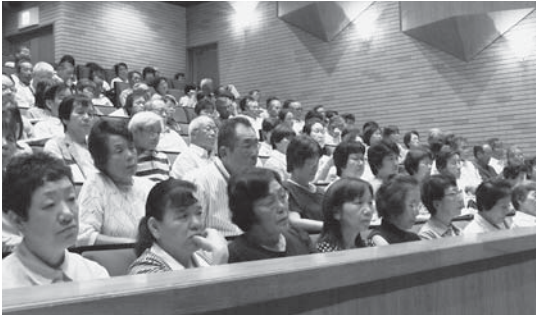
▲講演に耳を傾ける参加者（=8月28日、養父市立ピバホール）

この研修会は、区の福祉連 絡会（区長、民生委員・児童 委員、民生・児童協力委員、 福祉委員等で構成）と関係者 を対象に年一回、地域ごとに