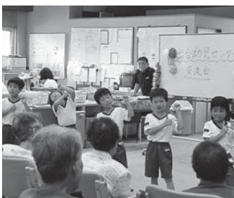
▲かわいいダンスを披露する園児(=9月5日、関宮ふれあいの郷)

養父市関宮193 関宮ふれあいの郷内 TEL: 667-3248 FAX: 667-3351