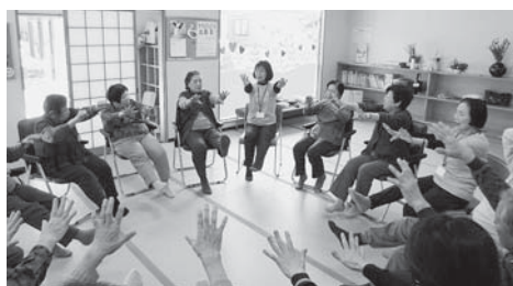
▲歌体操でボランティアと一緒に楽しく交流しました(= 4月23日、ふれあいいいききサロンそよ風)

サロンは、毎回約15人が利用しています。軽い運動やレクリエーション、手芸、季節の行事を取り入れたり、カラオケ、舞踊など趣味や特技を持ったボランティアや小中学校の子どもたちと交流したりしています。