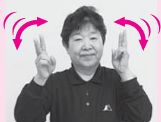
ひとさし指と中指を立てた両手を頭の横で交互に前後する「会社」