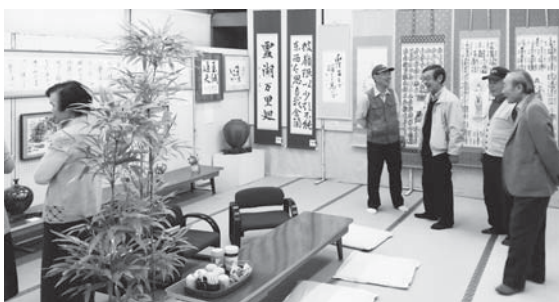
▲陶芸、写真、書など様々な作品が来場者を楽しませていました(= 4月19日、一部区公会堂)

村づくり会のメンバーは「区内には色々な趣味や特技を持った方がいます。出展を呼びかけ、多くの作品が展示できました。文化祭