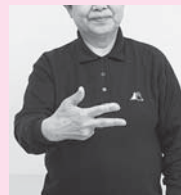
親指、ひとさし指、中指を上げ指文字の「し」をする