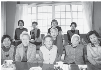
▲今日も元気な顔がそろいました (= 4月23日、大谷ミニホームひだまり)

養父市関宮193 関宮ふれあいの郷内 TEL: 667-3248 FAX: 667-3351