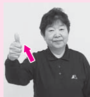
親指を立てて右手を出す「男性」※女性の場合は小指を立てます