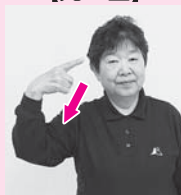
前に向けた右手のひとさし指を下に振りおろす「教える」