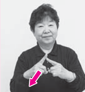
両手のひとさし指で「入」の字を作り、前に倒す「入る」