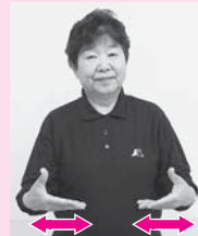
手のひらを上に向けた両手を左右から中央へ2回近づけたり離したりする「仕事」