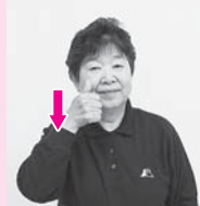
まっすぐ立てた親指の指先を目の下から真下におろす「慣れる」。※問いかけは少し顔を傾けます