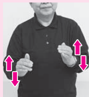
胸の前で向い合せた両手を互い違いに上下に動かす「世話」