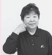
親指とひとさし指をつまんだ先でほほに触れ、前に出しながらひとさし指と中指を上げる「2ヶ月」