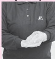
左手首に右手の指をあてて脈を測る仕草をする