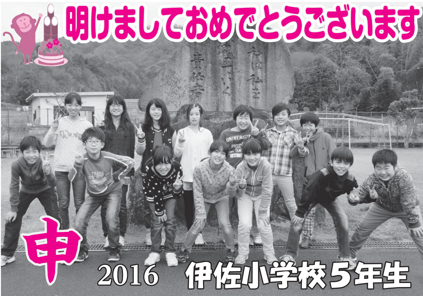
▲輝く笑顔を見せる伊佐小学校5年生。学級目標に「スクラム」を掲げ、みんなで手を取り合い一致団結して様々なことに挑戦していきます (=平成27年12月15日、伊佐小学校)

編集発行 / 社会福祉法人養父市社会福祉協議会 〒667-0022 養父市八鹿町下網場320 (地域交流センター「福祉の杜」) 平成28年1月15日発行 ■電話 (079) 662-0160 ■FAX (079) 662-0161 ■E-Mail yabu-shakyo@fureai-net.tv ■ホームページ http://www.yabu-shakyo.jp/