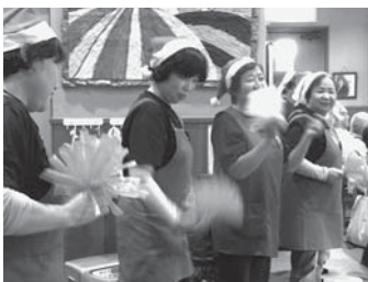
▲元気いっぱい踊りを披露するメンバー (=12月3日、関宮ふれあいの郷)

養父市関宮193 関宮ふれあいの郷内 TEL: 667-3248 FAX: 667-3351