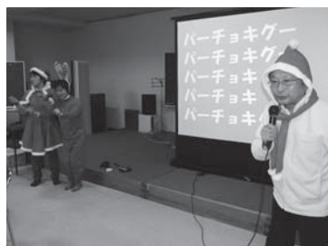
▲スクリーンに大きく文字を映し、見えづらさのある方のサポートをしながら進行

12月16日、八鹿老人福祉センターで「ありんこの会」がクリスマス会を開催し、市内の会員のほか、朝来市や香美町、京丹後市などから視覚に障がいのある方やその家族、支援するボランティア、ガイドヘルパーなど33人が参加しました。