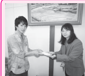
▲生徒よりバザー売上金を受け取りました(=12月11日)