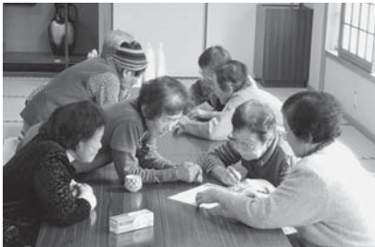
▲チーム対抗で『都道府県さがしゲーム』をしました。「オカヤマ」みつけた! (=12月20日、和田会館)

養父市大屋町加保678-1 大屋保健センター内 TEL: 669-1598 FAX: 669-0093