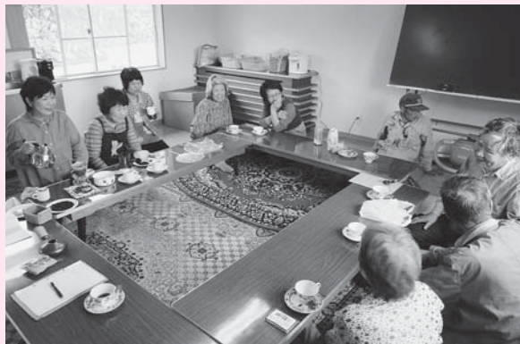
▶スタッフ、参加者ともに毎月楽しみに参加しています(11月5月16日、世賀居俱樂部)