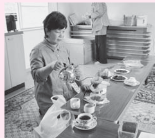
▲豆の煎り方や挽き方により香りや味が変わります

同カフェは、区内にこのの場を作りたいと考えた民生委員・児童委員が中心となり、昨年5月から始まったものです。毎月第3月曜日の10時から12時の間、集会所が開放されており、生の豆を会場で小型焙煎器とガスコンロで焙煎し、挽いた豆にお湯を注いだ本格コーヒーを提供しています。 当日、会場内はコーヒーの香ばしくも甘みのある香りが漂い、参加者はくつろぎながら「田んぼ仕事が忙しいや」「大忙しやけど行く前に一杯飲みきたんや」「風強いから気をつけんせえ