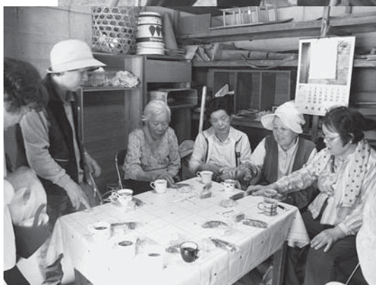
◀コーヒーを飲んで一休み。おしゃべりもはずみです

万久里区では毎週月・木曜日の午後、ふれあいひろばに愛好者が集まり、グラウンドゴルフを楽しんでいます。