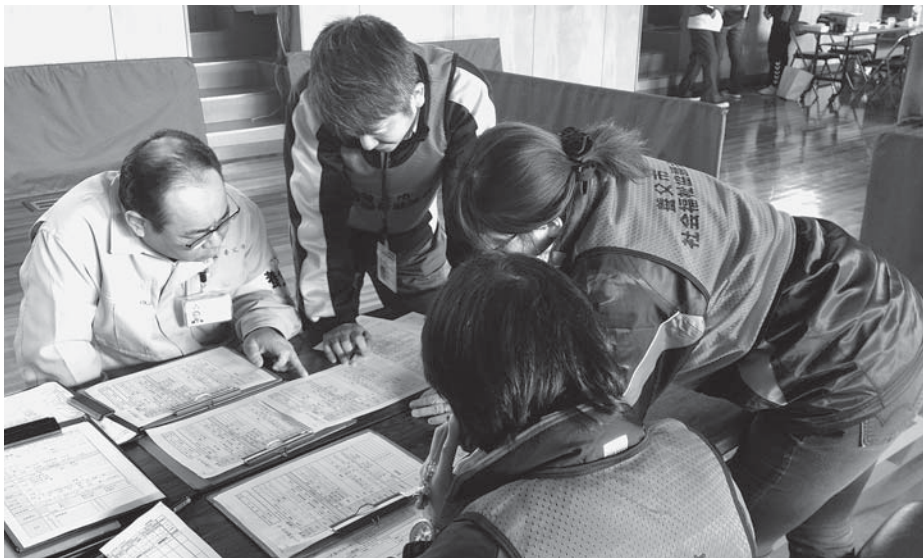
▲災害ボランティアセンター立ち上げ訓練において、被災者ニーズについて話し合うスタッフ (=平成27年11月28日、養父体育館)

5月30日に第34回評議員会を開催し、平成27年度事業報告および決算報告が承認されました。 平成27年度は、第2次地域福祉推進計画の福祉目標「ささえあう心で笑顔あふれる福祉のまちづくり〜みんなでつくる みんなのしあわせ〜」のもと、地域にある生活・福祉課題を地域住民やボランティア、行政等関係機関がそれぞれの役割を担い、連携を図りながら事業に取り組みました。 一層厳しい経営状況の中で進めた、昨年度の事業、決算を一部抜粋してお知らせします。(事業報告書と決算書は各支部でご覧になれます)