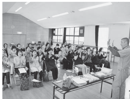
▲子育て支援ボランティアの養成講座を開催。子育て支援の輪を広げています（平成28年3月15日、旧八鹿幼稚園）