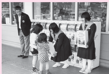
▲養父中学校生徒会が中心となり、八鹿ライオンズクラブと一緒に義援金の募金活動を行いました(=4月29日、やぶYタウン)

また、4月29日には、八鹿ライオンズクラブと共催し、やぶYタウンにおいて募金活動を実施しました。祝日という事もありたくさんの方にご協力いただき、38,691円の義援金が集まりました。