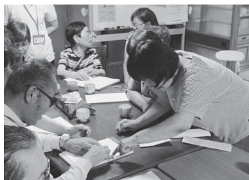
▲点訳ボランティアあかりの皆さんが、ありんこの会（視覚に障がいのある方とその家族の会）に点字学習を行い交流しました（平成27年8月24日、地域ふれあいの家八鹿）