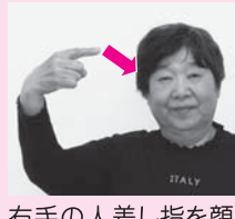
右手の人差し指を顔の斜め上に持っていく、上から顔に向けて下げる「教わる」