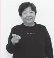
人さし指を立て、相手を指さす「あなた」