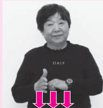
軽く握った左手の横で、右手を上下させながら左へ「料理」