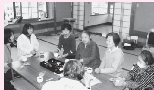
▲体を動かした後は、茶話会

第1回目となったこの日は、養父市シルバー人材センターの「笑いと健康お届け隊」の隊員3人から、昨年度教わったやぶがらぼう