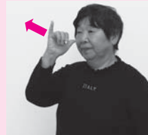
親指と小指を立てて親指の先を鼻の頭に向け、前に突き出すように動かす「得意」