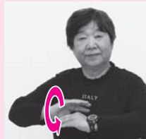
左手の甲に沿わせて右手を前へまわす「オムライス」