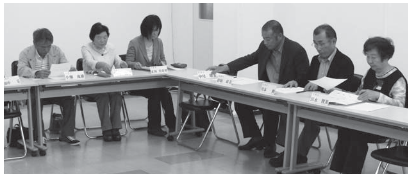
▶評議員会では法人の重要な事項が決議されます(11月4日21日、福祉の社)