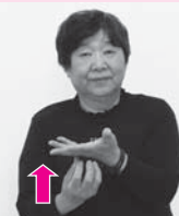
手の平を上に向けた左手の甲を、指を軽く折り曲げた右手で軽くたたく