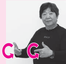
親指を立て人さし指を向い合わせた両手を手前から前方へまわす「いつも」