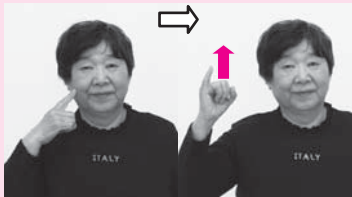
人さし指を頬に当て、小指を立てた手を少し上げる「母」