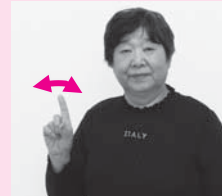
人さし指を立て、左右に軽く振る「なに」 ※質問をするときには軽く首を傾げる