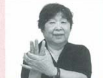
指先を上に向けた右手の人さし指、中指、薬指を左手で軽く囲む「温泉」