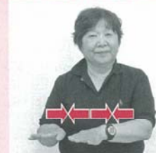
両手のひらを下に向け指先を前に向け、2回ほど親指同士を近づけたり離したりしながら横に移動する「連休」