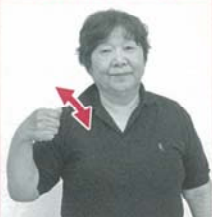
うちわを持ち仰ぐように数回動かす「夏」