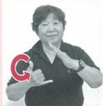
左手で写真のように屋根をつくり、右手親指と小指を立て軽く手首を振る「家族」