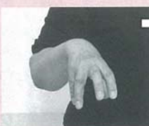
指を開いて軽く折り曲げた手をおろす「場所」。人さし指を立て左右に振る「何」※質問をするときには軽く首を傾げる