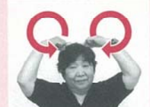
両手の人さし指で頭の上にミッキーマウスの耳の形を描く