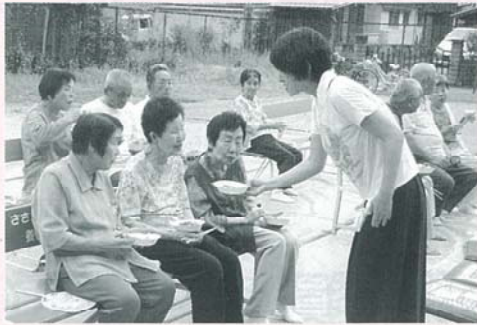
▶「できたておいしいですよ」と子ども役員さんが参加者へフランクフルトを届けていました(7月22日、おうみ公民館前広場)