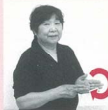
指先を前に向けた左手の横で、右手の人さし指と中指をまわす「旅行」