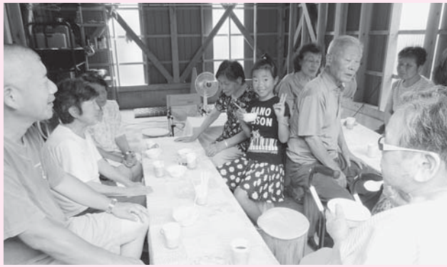
▲会場にくる人はみな笑顔で参加し、「待ってとたて。こっちきんせえ」と声をかけ、互いの近況など話し合っていました(=7月23日、石原区内ガレージ)

の日は、麦茶やコーヒー、ジュース各種と手作りの冷たいあんみつがふるまわれました。次々と来場する人のなかには「畑仕事の合間に今日喫茶しているのを思い出して休憩がてらきたでえ」と参加する人や、帰省していた家族が「喫茶をしていると聞いて子どもたちときました」と参加す