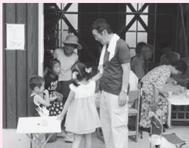
▲地元の子や帰省中の子も一緒になって楽しんでいました

7月23日、石原区内の個人の車庫で「石原区ガレージ喫茶」がオープンし、区民44人が参加しました。喫茶は、福祉連絡会のメンバーが中心となり、子どもから高齢者まで一緒に親睦を深められたらと考え、3年前から年2回開催しています。こ