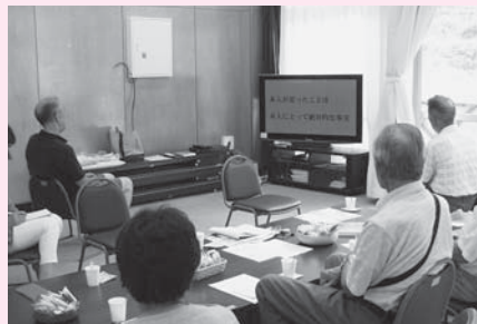
▲8月は認知症を理解するためのビデオ観賞会を開催