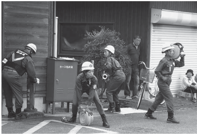
▲女性消防団員による初期消火訓練も行われました

▲小城区では、消防団の指導による消火器訓練や、炊き出し訓練などが行われました（11月9日、木の香る小城交流促進センター）