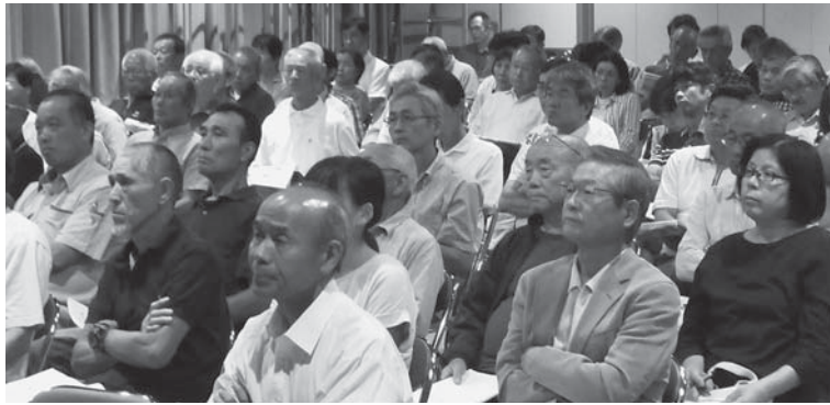
▶講演に耳を傾ける参加者（9月8日、関宮ふれあいの郷）

この研修会は、福祉連絡会（区長、民生委員、児童委員、民生児童協力委員、福祉委員等で構成）と関係者を対象に毎年開催しています。