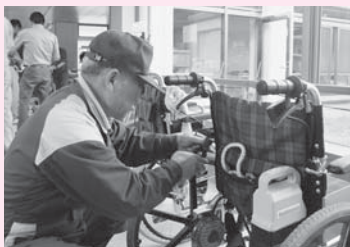
▲車いすの背もたれのネジをしっかりと締めます(=9月16日、関宮ふれあいの郷)

この活動は、同協会が地域貢献活動として続けており、今年度で6回目となります。協会所属の11人が車いす25台