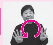
手話数字の「2」と「4」を同時に矢印のように回す