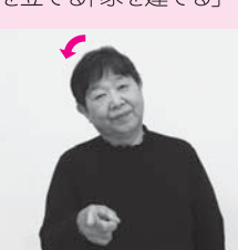
どちらがいいか確認のため人さし指を相手にむけながら頭を横に傾けて質問する