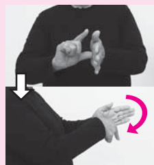
人さし指を伸ばし、親指を左手の平に当てて右手を前方に回す「場合」