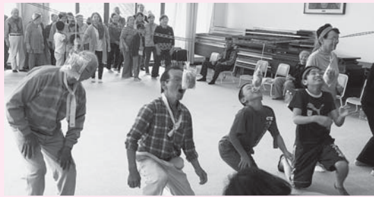
▲運動会の名物「パン食い競争」。狙ったパンをめがけてお口をあ〜んっ!