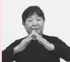
両手の指先をつけて屋根の形をつくる「家」