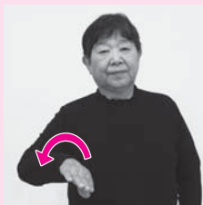
手の平を下に向けた右手で山の形を描く「山」