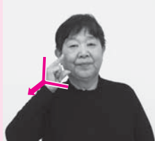
ほおを親指と人さし指でつまむように動かしてほおから離す「もし」