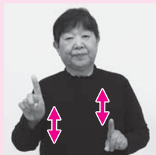
両手の人さし指を上に向け、交互に上下に動かす「どちら」