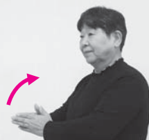
指先を相手に向けて屋根の形をつくり、そのまま指先が上を向くように腕を立てる「家を建てる」