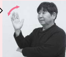
左手甲にひじをあてた右手を前後に振る「役」