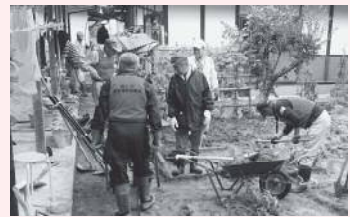
▲丹波市の災害支援の様子

共同募金改革の一環として、平成28年度から、全都道府県において共同募金運動期間を従来の10月～12月に加え1月～3月まで拡大することになりました。この拡大期間では、地域課題解決のためのテーマを設定した募金などが展開されています。養父市共同募金委員会では、身近なところで「命を守る」迅速な対応と近隣同士の「お互い様の助け合い」ができるよう災害用資機材を購入・配備し、地域をともに創っていく「創縁社会」の一助を目的に取り組みます。(振り込みについては社協へお問い合わせください)