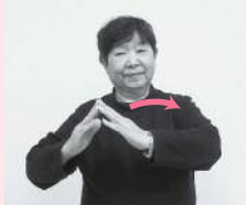
両手の指先を合わせ屋根の形を作り、右から左へ動かす「引越した」