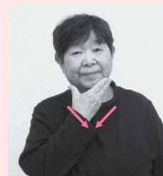
アゴをはさむように指をつけ、沿うように指を閉しながら少し下におろす「便利」