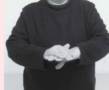
左手の甲に右手のひらをあてる「手」