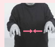
指を開いて軽く折り曲げた両手を近づける「近い」