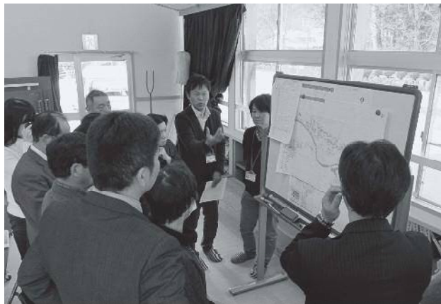
▲福祉防災マップづくりを進めてきた経緯や、要援護者の情報管理についても話し合いました（=12月18日、西谷ふれあいの家）

福祉防災マップづくりをきっかけに、地域での福祉活動が活性化した区も多く、この取り組みは、市外からも注目されています。今回、宍粟市社協が筏区を視察した様子をご紹介します。