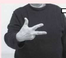
右手の親指と人さし指、中指を立て指文字の「し」を作る「市」