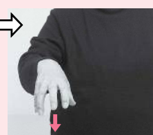
指を開いて軽く折り曲げた手をおろす「所」