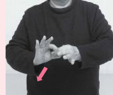
両手の親指と人さし指で輪っかをつなぐように作り前へ出す「続き」