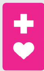
赤地に白抜き のマーク

このマークは、援助が必要な方のための「ヘルプマーク」といいます。東京発で全国的にも広まっています。