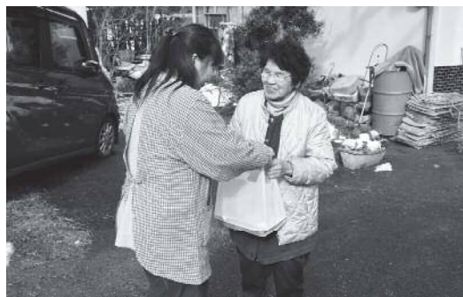
須西区福祉連絡会による高齢者宅友愛訪問（平成29年12月17日）

・ 関宮ふれあいの郷とデイサービスセンター「ふれあい」を多世代多機能施設へ転換するための協議をすすめる