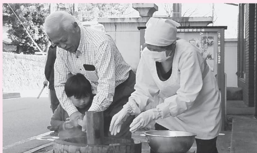
▶手伝ってもらいながら杵をふるいました(12月2日 吉井公会堂前)