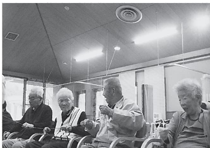
▲明るくなった室内でゲームを楽しむ利用者（＝関宮通所介護事業所 機能訓練室）

事務所管理費の削減が図れるよう、支部運営委員会、理事会の協議により、養父支部、大屋支部、関宮通所介護事業所の照明を一部LED照明に換えました。関宮通所介護事業所の利用者からは、照明が明るくなったことで「雰囲気良くなくなった」「前よりも相手の表情が見やすくなった」と喜びの声をいただきました。