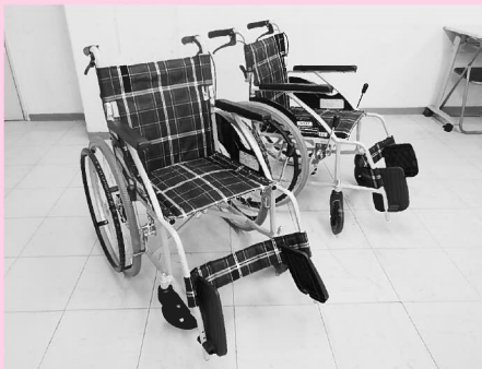
贈呈された車いす