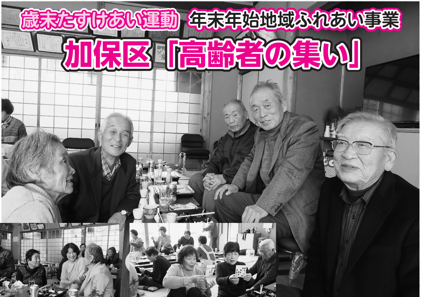
◀食事の後には、参加者全員で ビンゴゲームを楽しみました

1月26日、加保公民館で開催された「高齢者の集い」には、加保区内の80歳以上の高齢者31人のうち17人が参加しました。