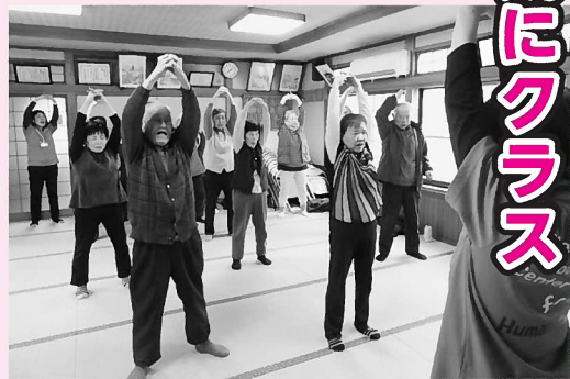
▶元気に体操に取り組み皆さん

この日は、兵庫県健康福祉部少子高齢局から3人の職員が視察に訪れ、13人の参加者は日頃にも増して、張り切って体操に取り組み、掛け声や呼吸を合わせながら腕や足、背筋を伸ばしたり、身体を動かしたりと、さまざまな運動を行いました。