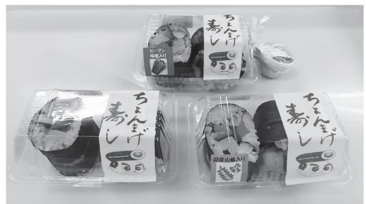
▲「ちょんまげ寿し」は3種類。田舎風の巻き寿司（左）、朝倉山椒入り（右）、ピーマン味噌入り（奥）。巻き寿司のちょんまげを結った、可愛いお侍のイラストが入っています

今後の目標は、タッキー号（市町村運営自家用有償旅客運送事業）の運行のエリア拡大です。現在、毎週月曜日の唐川線と餅耕地線の2路線のみですが、そのほかの地域住民にも、公共交通機関のバス停までの移動手段として幅広く活用できるように、市を通して陸運局と調整を行っています。