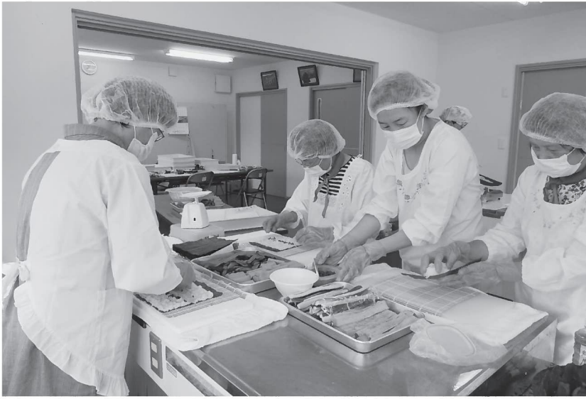
▲毎週土曜日の早朝、加工部門の隊員があつまり、「ちょんまげ寿し」を調理しています（=9月12日、建屋教育集会所別館）