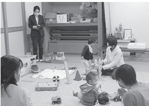
▲動画制作のため子どもの様子を撮影する市職員（=11月10日、三宅団地集会所）