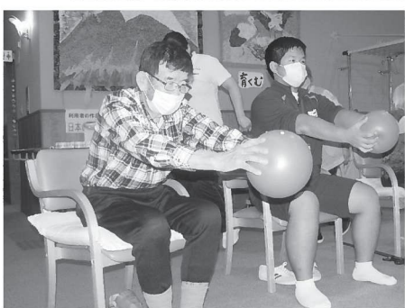
◀体のバランスや姿勢をよくするボール体操にも挑戦（=11月19日）