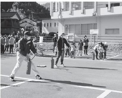
▲消防教室では、火災時の対応や消火器を使った消火方法について消防署員から説明があり、区民が実際に体験しました