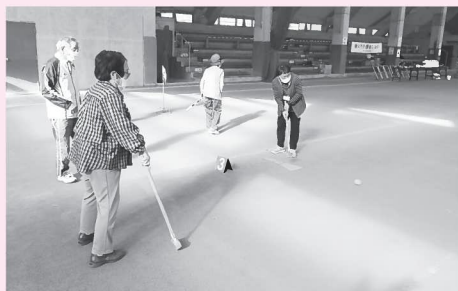
▲ねらいを定めて「えい!」。コーン、コーンとボールを打つ音が飛び交いました (=11月18日、全天候運動場)

当日、5グループに分かれた参加者は、優勝をめざし運動場に作られた長・短距離の8コースに挑戦しました。