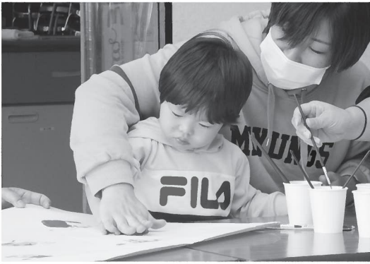
▲メッセージボードに親子でしっかり手形を押しました（=10月29日、関宮ふれあいの郷）

10月29日「手作り広場ほわほわ」が開催されました。手作り広場ほわほわは毎月1回関宮ふれあいの郷で活動しています。