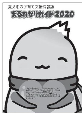
▲養父市社協ホームページからダウンロードできます