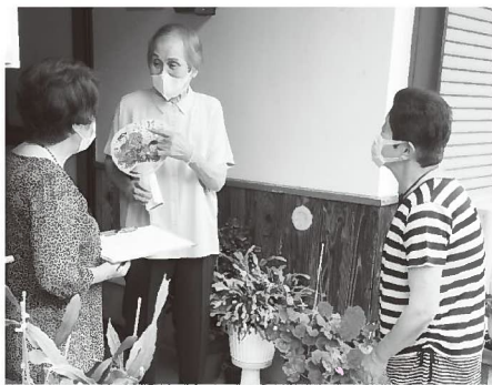
ボランティア・市民活動の支援 ボランティアの養成や相談、調整、活動支援など