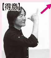
親指と小指を立てた手を鼻先から少し前へ出す