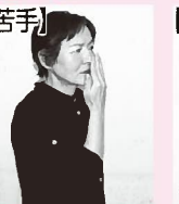
右手4指を伸ばし、鼻先にあてる