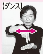
左手のひらの上で、右手人さし指と中指を伸ばし左右に振る