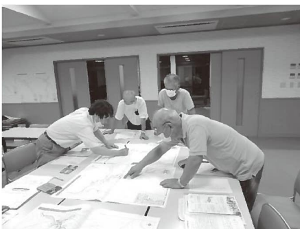
見守りあいや地域での交流事業の支援など 福祉防災マップの作成など