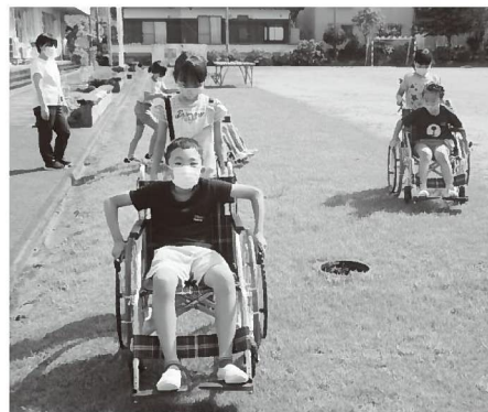
学校や地域での福祉学習 体験教室や認知症学習など