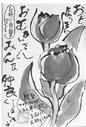
在宅福祉サービス 給食サービスや移送サービス、ふれあい郵便、介護用品のあっせんなど