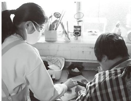
介護サービス・障害福祉サービス ヘルパー派遣やデイサービス、ケアマネジメント、福祉用具貸与、相談受付など