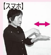
スマホに見立てた左手のひらの上で、右手人さし指を横に振る