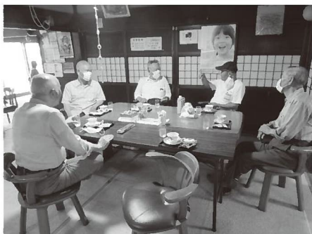
小地域福祉活動の推進 災害にも強いまちづくり