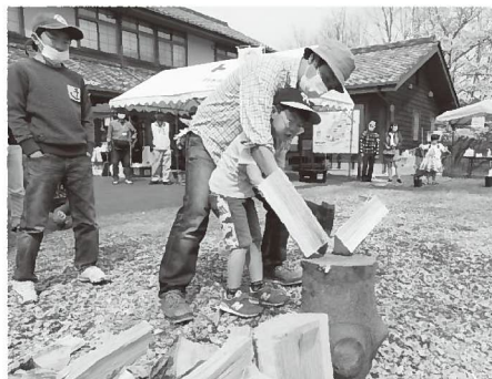
子育て支援 子どもの冒険ひろばラリーパークなど