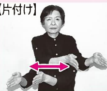
手のひらを向き合わせ、同時に右に移動させる