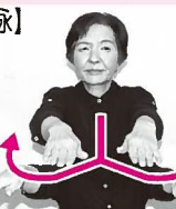
水泳の平泳ぎのように両手を動かす