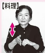
左手を軽くにぎり材料を押さえ、右手の包丁で切るしぐさをする