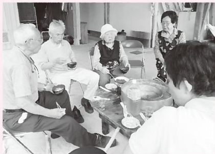
▲「おいしいなあ」。大勢で食べるそうめんの味は格別です

流しそうめん機2台を設置し、参加者は検温と手指消毒の後、間隔をあけて座り、水流を増やす、取り分けをするなどの感染症対策をしながら、ツルツルと滑らかなそうめんを食べ、食後には農作業や野菜などの話で親睦を深めました。