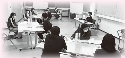
▲第2回職員作業部会で意見を出し合うメンバー(=11月19日、福祉の社)

第3次地域福祉推進計画2019～2023の福祉目標「だれもがつながり ささえあういのち輝くまちづくり～オール養父市で未来へ～」の実現に向け、計画の進行管理を確認する前段階として、職員作業部会が11月8日から始まり、計画の進捗状況の確認を行なっています。