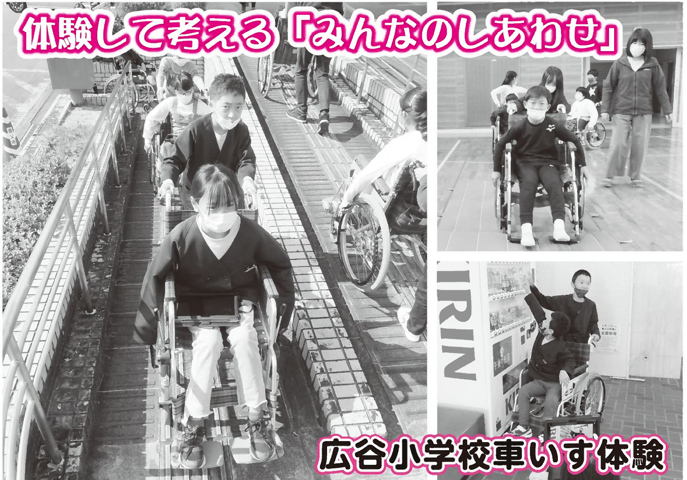
▲養父地域局前のスロープを体験。「ひとりで坂道をのぼるのは大変」と声をあげて手伝いを頼む児童やひとりで頑張っている児童もいました (=10月29日、養父地域局前)

「溝にある蓋(グレーチング)に前タイヤがはまって動けない」「自動販売機の一番上のボタンは押せない」などの発見もあり、困っている人がいたら声をかけること、手助けが必要なことを再確認しました。また、どう介助すればよいか、どうすれば誰もが通りやすくなるかなどを体験とおしてみんなで考えました。