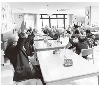
▲毎回多くの方が利用するデイサービスセンター「ふれあい」

地域密着型になることにより、関宮地域の方やボランティアが入りやすい環境を整え、アットホームな運営を目指していきます。いずれにしても施設の所有者である養父市と連携しながら今後の方向性を協議していきます。