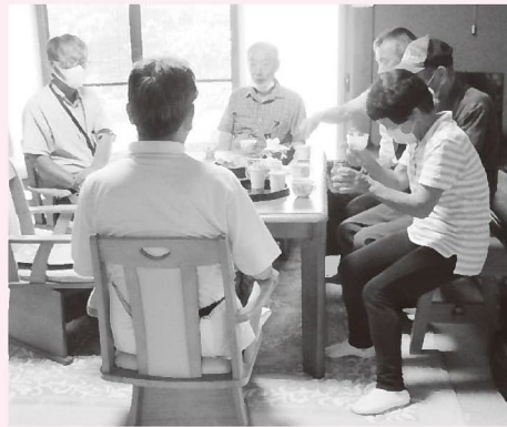
▲介護する者同士で語り合ったり、認知症について学んだり、ほっとひと息をつく場です

認知症カフェは、認知症の人やその家族、地域住民が気軽に立ち寄れる集いの場（地域の交流・相談の場）です。養父市内に6か所の認知症カフェがあります。 また、但馬内にはたくさんさんの認知症カフェがあり、本人と家族や地域住民のほかにも介護の専門職など、誰でも参加できて、お茶を飲みながら話をしたり、交流を深めたりしています。詳細は社協本部まで。