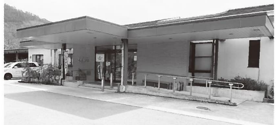
▲デイサービスセンター「ふれあい」は、平成元年3月に旧大屋町が開設し、デイサービス事業の運営を社協が開始しました。大屋地域唯一の通常型デイサービスセンターとして役割を担い34年が経過しています

養父市社協では、平成18年度からこの制度により、2施設を養父市から受託し運営しています。今回で5期目となります。