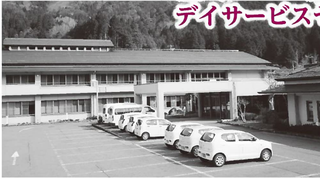
▲関宮ふれあいの郷は、平成6年に老人福祉センター、デイサービスセンター、保健センターの3つの機能をもつ施設として旧関宮町が設置。間もなく築28年を迎えようとしています