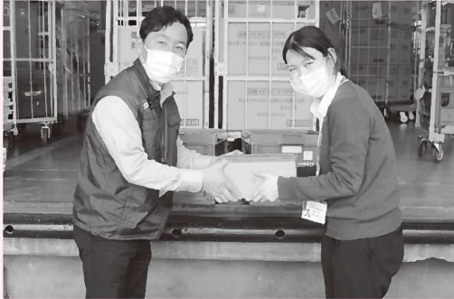
▲生活協同組合コープこうべから毎月さまざまな食材が預託されます

養父市社協と生活協同組合コープこうべが連携して、やむなく返品となった宅配商品の一部を生生活困窮世帯やこども食堂などに提供することから始まったフードバンク事業は、今では市民の皆様からの食材預託も多くあります。