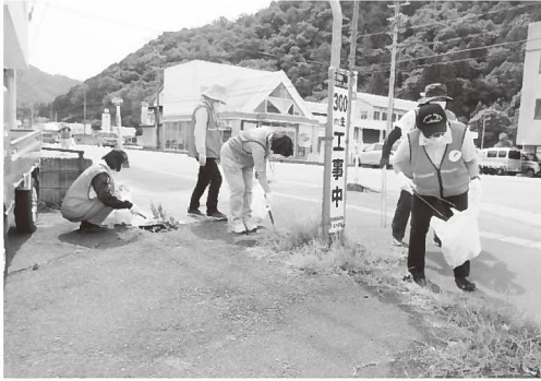
▲県道6号線から養父市役所、諏訪橋前までのごみ拾いをしました