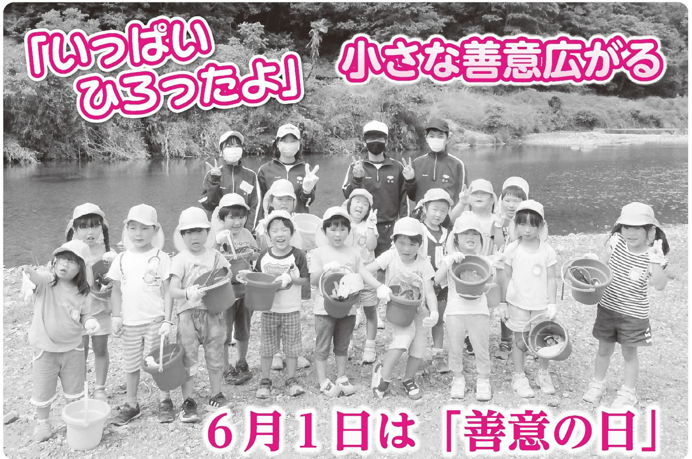
▲大屋こども園でトライやる・ウィーク活動中の大屋中学校の生徒4人もいっしょにごみ拾いをしました