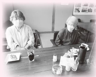
▲本格的なコーヒーとケーキのセットに「美味しい!」と評判です

入口での消毒や検温のほか、席の間隔を広めにとり、アクリル板を設置するなど感染予防策にも努めており、来場者もゆったりと過ごすごとができます。一番人気のメニューは、飲み物にトーストとサラダ、ゆで卵が付いたモ