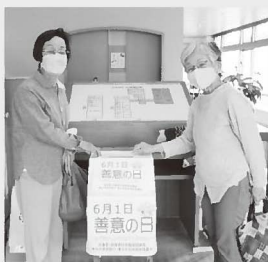
▲「今日は善意の日やったね」と住民の方からの募金もありました