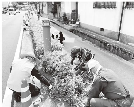
▲大屋地域局周辺のグリーンベルトの草抜きやごみ拾いをする民生委員・児童委員のみなさん