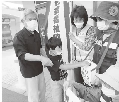
▲Yタウンでの募金活動には、子どもから高齢者まで多くの方に協力いただきました

養父地域局や社協養父支部、街頭で啓発募金活動を実施しました。街頭募金では、養父女性民生委員ボランティアグループと共同でYタウンの店舗来店者に善意の日の募金を呼びかけました。