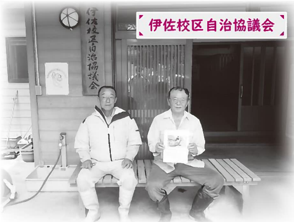
伊佐校区自治協議会