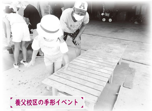
養父校区の手形イベント