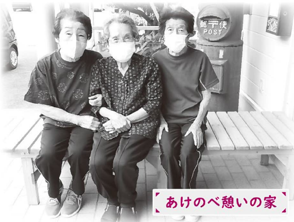
あけのべ憩いの家