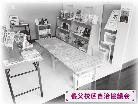
養父校区自治協議会