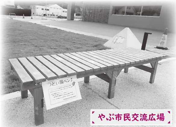
やぶ市民交流広場

散歩の途中で「ちょっと一息」、農作業の合間の「ちょっと一息」など、みんなが集まる場所に「つどい場ベンチ」があります。設置完了後、市内の設置場所を「つどい場マップ」にして、地域のみなさんが「つどい場」を紹介します。