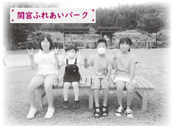
関宮ふれあいパーク