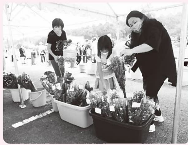
▲生産者9人が出品した花はすぐに完売しました

開店すると、感染予防対策のため入場制限をしながらも次々と花や野菜が売れ、30分後にはほぼ完売状態となっていました。