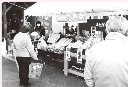
▲大谷校区協議会の有機農業体験型農園で栽培した自慢の野菜の販売もありました

参加者からは「最近 は外出を控えています が、親子で楽しく過ご せました」「多くの 団体が協力しているだけでは なく、地域住民の力を感じる 素敵なおイベントでした」と喜 びの声も聞かれました。