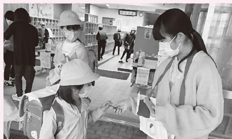
▲関宮学園での募金運動の様子

皆さまから寄せられた募金は、兵庫県共同募金会に送金後、令和5年度に県内の福祉施設や福祉団体、各市町の共同募金委員会に配分されます。