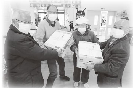
▲社協役員が市内の障害者通所施設にみかんを持って訪問しました（=令和4年12月16日、さつき福祉社会おや作業所）