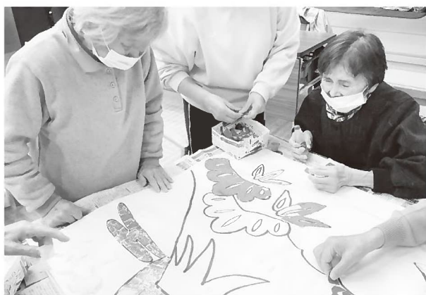
▲デイサービスの季節の飾りつけはほとんど利用者のお手製。今年も立派なお正月の飾りができました

地域密着型通所介護は、1日の利用者数が18人以下の小規模事業所が行うデイサービスです。