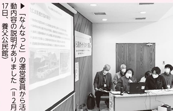
▶「なんなっと」の運営委員から活動内容の説明がありました（11月17日、養父公民館）

に、くらしの助け合いの会「なんなっと」（豊岡市、以下「なんなっと」と）と大谷校区協議会の実践発表、「猫の手くらぶ（宮垣）」から情報提供がありました。「なんなっと」は6年間の活動とおして、支援者が楽しんで活動することの大切さを伝えました。大谷校区協議会は、生活アンケートを実施し住民のニーズを分析。高齢者の生活の質の向