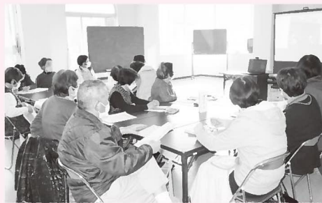
▲オンラインで研修を受ける参加者（＝大屋保健センター）

に、くらしの助け合いの会「なんなっと」（豊岡市、以下「なんなっと」と）と大谷校区協議会の実践発表、「猫の手くらぶ（宮垣）」から情報提供がありました。「なんなっと」は6年間の活動とおして、支援者が楽しんで活動することの大切さを伝えました。大谷校区協議会は、生活アンケートを実施し住民のニーズを分析。高齢者の生活の質の向