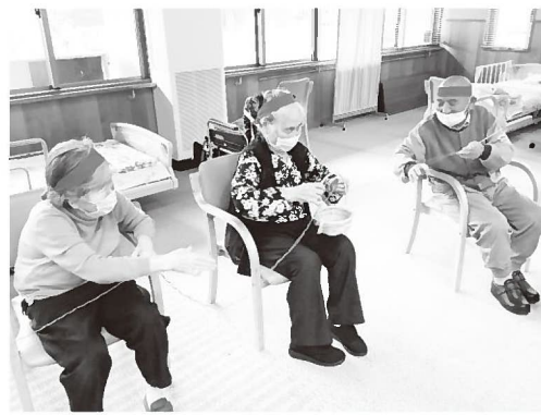
▲かごや輪をひもにとおして隣に送る「もの送り競争」では声をかけあいながら体を動かします

個別機能訓練とは違い、集団で楽しみながら体操やゲームをしたり、得意なことを活かして干し柿づくりや季節ごとの作品を作ったりしています。