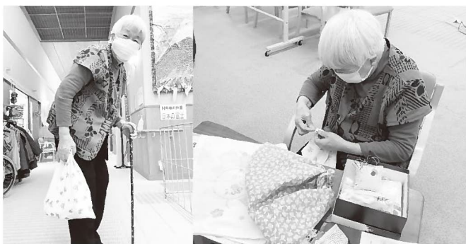
▲裁縫が好きだった利用者が、昔のことを思い出しながら手指の運動もかねて手提げ袋を作りました。すてきな作品ができて笑顔がこぼれていました