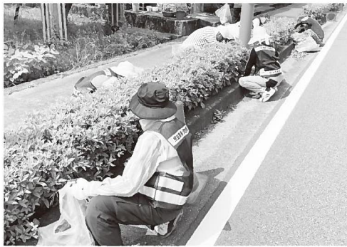
▲大屋地域局周辺の清掃活動をする民生委員・児童委員のみなさん

昭和38年に兵庫善意銀行が設立されたことを記念し、翌年の昭和39年6月1日に「善意の日」が制定されて以来、県内各地で善意の活動が広がりました。 今年も市内で実施された善意の活動を紹介します。