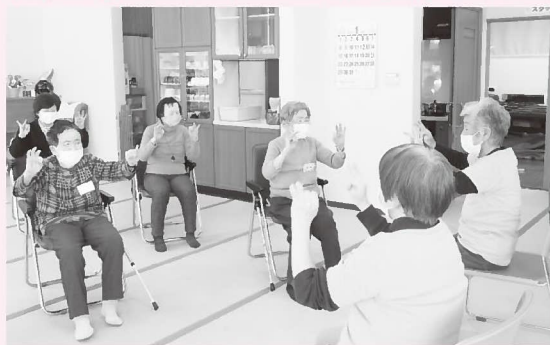
▲ボランティアによる体操の様子（=ふれあいいきいきサロンそよ風）