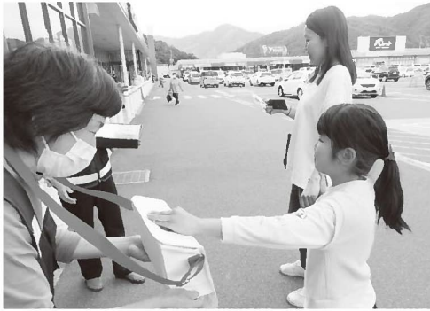
▲Yタウンでの募金活動では、幅広い世代から協力いただきました

養父市社協は、養父市役所本庁や各地域局、福祉の杜などで募金活動をしました。 Yタウンでは、養父女性民生委員ボランティアグループが、募金活動に併せて特殊詐欺予防の啓発も行いました。 また、大屋地域のこども園の園