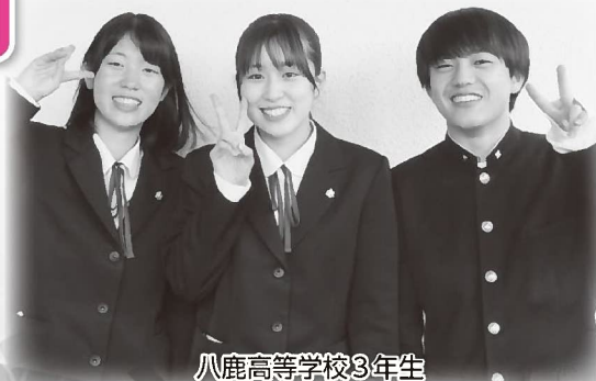
八鹿高等学校3年生

4月から新しい生活が始まります。将来の夢や目標に向かって、勉学に励み、主体的に学んでいきたいです。将来、地元養父市がより良い町となるように貢献できる存在になれるよう、頑張ります！