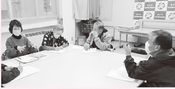
▲講演を聞いて、自分にできる防災や地域でできるたすけあい活動について話し合いました（=12月11日）