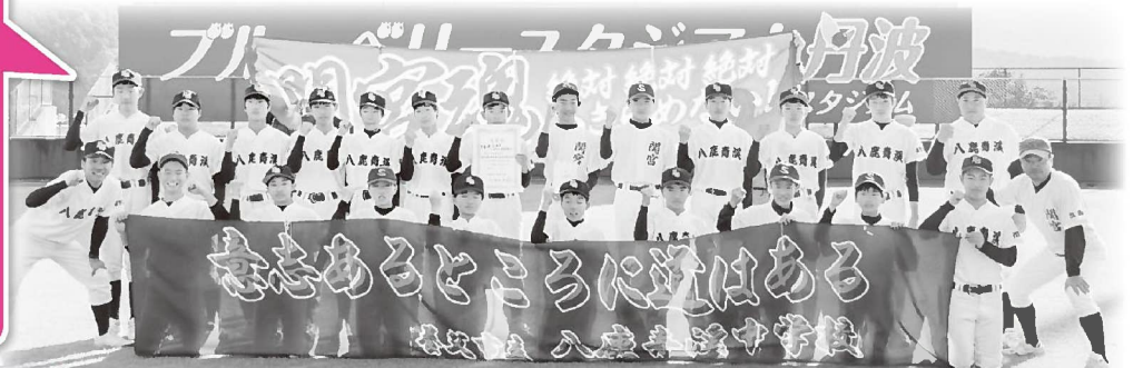
養父市立八鹿青溪・関宮学園クラブ

「他喜力」見ている方に感動を届け、目標である但馬無敗、県大会優勝、全国大会出場を目指して頑張ります!!