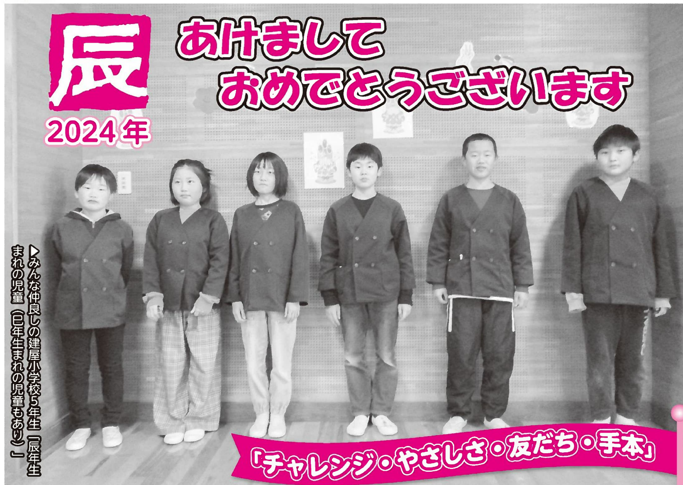
▼みんな仲良しの建屋小学校5年生「辰年生 まれの児童(巳年生まれの児童もあはれ)」