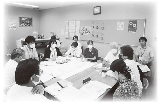
▲グループワークを中心に意見交換を行いました（写真は第2回策定委員会、=9月25日）