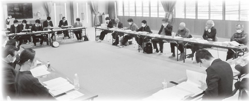
▲第6回策定委員会では福祉目標や基本活動の最終確認を行いました（関宮ふれあいの郷）

養父市の地域福祉の将来像を描く第4次地域福祉推進計画策定委員会（全6回）が終了しました。