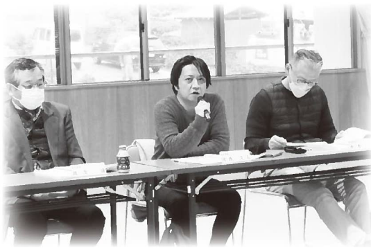
▲計画策定に向けた想いを語る委員