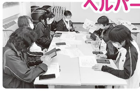
▲ICTを活用しての机上訓練の様子