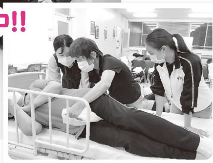
◀▲マイスター認定に向けて練習

「やっぱり我が家はええなあ〜」という利用者の願いを叶えるため、住み慣れた家で一日でも長く暮らし続けることができるよう、ヘルパーは日々研鑽を重ねています。 令和5年度実施した利用者満足度アンケートに「オムツのあて方がゆるい気がする」との声がありました。そこで「排泄介助」をテーマに取り上げ、利用者には気持ち良く過ごしてもらえようように検討しました。一人一人の技術向上のためTENAマイスター認定試験(※上記参照)の講習を受講し、受講した22人全員が認定を受けることができました。