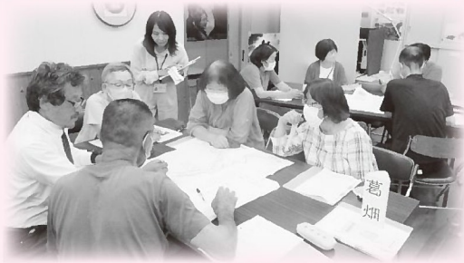
▲年間の取り組みは福祉連絡会で検討しています。 (写真は7月3日の出合地区福祉委員会)