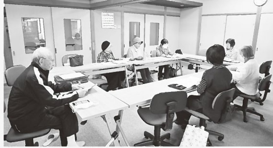
▲八鹿R.V.Cひよっこ 定例会のようす(=11月15日)