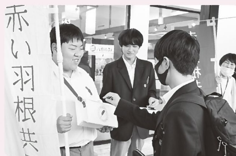
▲道の駅ようか但馬蔵での募金運動の様子

みなさまから寄せられた募金は、兵庫県共同募金会に送金後、配分委員会の審議を経て、令和7年度に県内の福祉施設や福祉団体、各市町の共同募金委員会に配分されるほか、災害等準備金として積み立てられ、被災地を支援します。