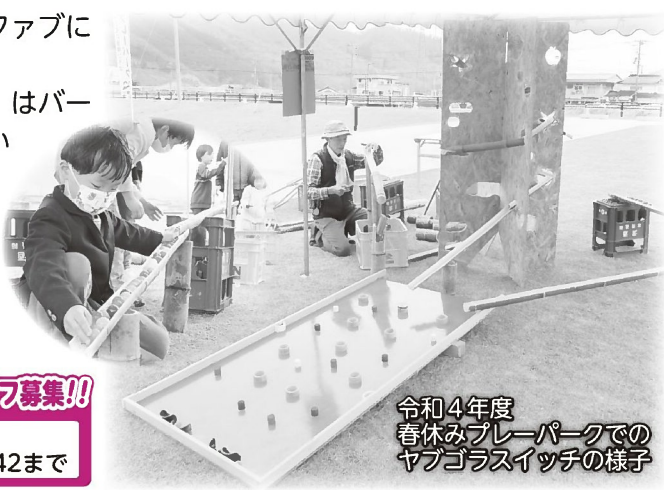
令和4年度春休みプレーパークでのヤブゴラスイッチの様子