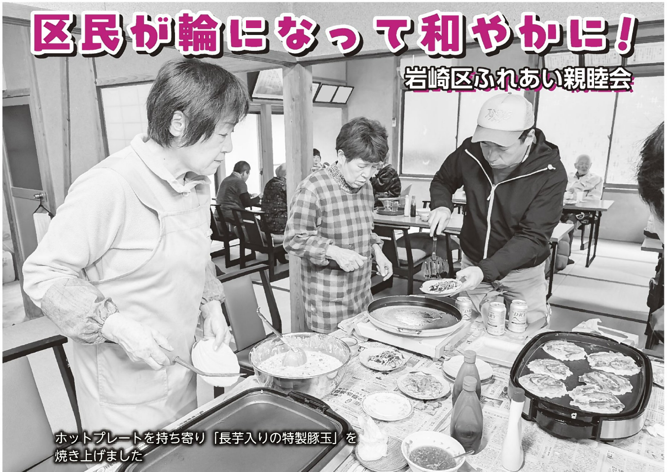
ホットプレートを持ち寄り「長芋入りの特製豚玉」を焼き上げました