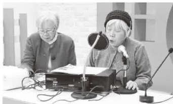
▲長年の歩みに感謝を込めて一言一言を大切に読み上げるメンバー

このたび、メンバーの減少と利用者ニーズの変化により、3月末をもって活動を終了することになりました。30年以上にわたり、市内の視覚に障がいのある方の支援にご尽力いただき、ありがとうございました。